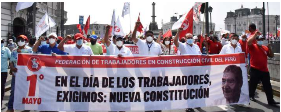
1 de mayo de 2022: Construcción civil en marcha por el Día Internacional de los Trabajadores.