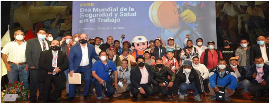
28 de abril de 2022: Foro por el Día Mundial de la Seguridad y Salud en el Trabajo.