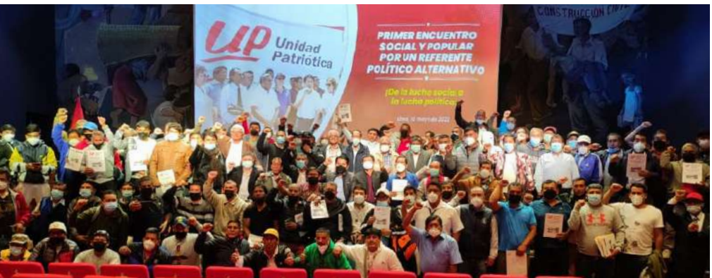
26 de mayo de 2022: Encuentro Social y Popular por un Referente Político Alternativo.

Esta licencia es otorgada por el empleador por el plazo máximo de siete (7) días calendario, con goce de haber. En caso de ser necesario más días de licencia, estos serán concedidos por un lapso adicional no mayor de treinta días, a cuenta del derecho vacacional.