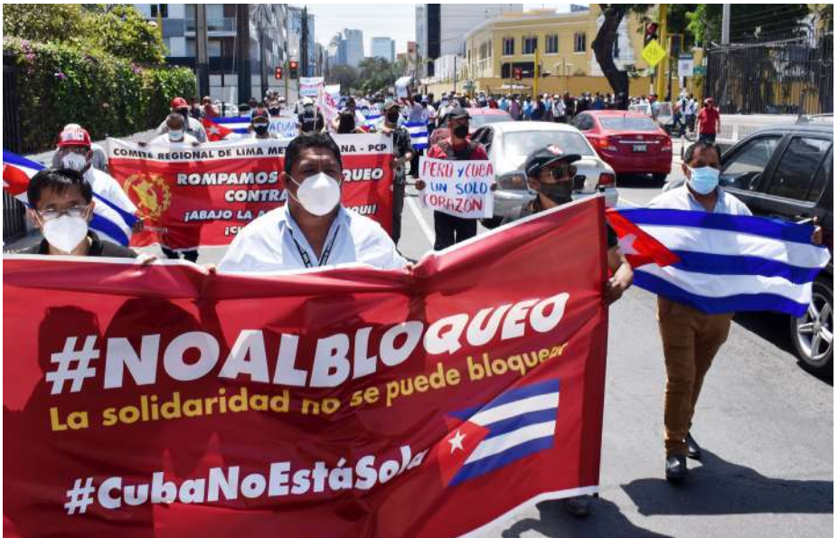
15 de marzo de 2022: Plantón de clase trabajadora en respaldo a la Revolución Cubana.