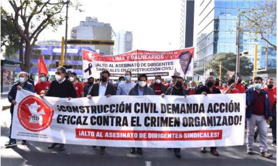
Movilización contra el Crimen Organizado, del 08 de julio de 2022, rumbo al Ministerio del Interior.