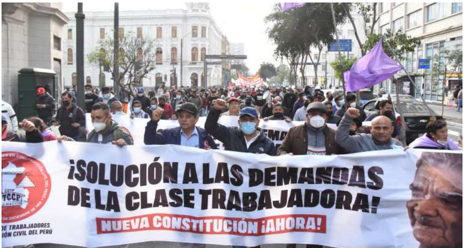
27 de junio de 2022: Jornada de lucha por la solución a las demandas de la clase trabajadora.